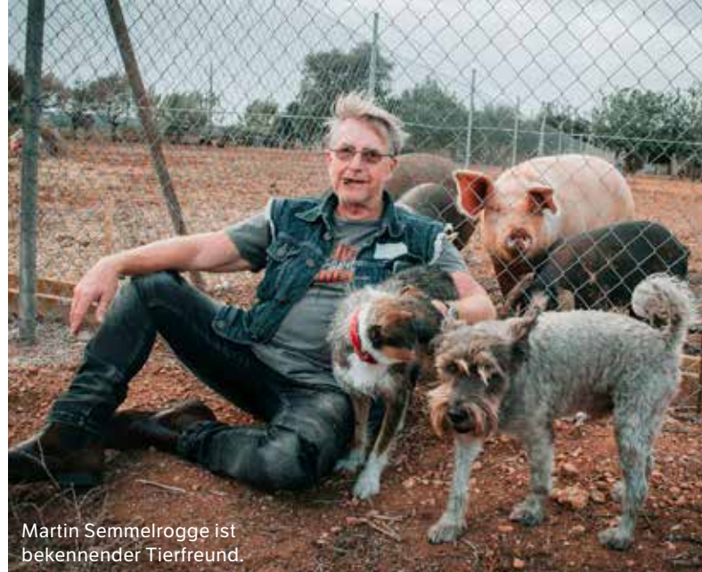
Martin Semmelrogge ist bekennender Tierfreund.

ziemlich großartige Erinnerungen: Rolling Stones, Neil Young ... Alles Künstler, die ich auch in späteren Zeiten immer wieder gern gesehen hab. Ich war in den Siebzigern eine Zeit lang in London, an die erinnere mich mich auch ausgesprochen gerne. Da war der Punk damals ja der heiße Scheiß, das hat mich ziemlich geflasht. Wenn ich die Rolle in Das Boot nicht bekommen hätte, wäre ich vielleicht dageblieben. Komischerweise war bei meiner Rückkehr nach London die Luft aber auch etwas raus, es war nicht mehr wie vorher.