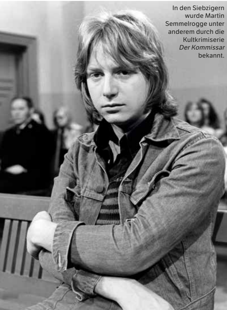
In den Siebzigern wurde Martin Semmelrogge unter anderem durch die Kultkrimiserie Der Kommissar bekannt.