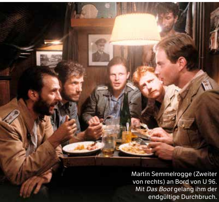
Martin Semmelrogge (Zweiter von rechts) an Bord von U 96. Mit Das Boot gelang ihm der endgültige Durchbruch.

„Es gibt irrsinnig viele Schauspieler, aber echte Typen werden immer weniger. Von daher ist offensichtlich auch noch Bedarf für mich.“